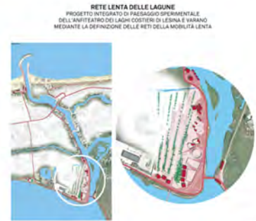
RETE LENTA DELLE LAGUNE PROGETTO INTEGRATO DI PAESAGGIO SPERIMENTALE DELL'ANFITEATRO DEI LAGHI COSTIERI DI LESINA E VARANO MEDIANTE LA DEFINIZIONE DELLE RETI DELLA MOBILITÀ LENTA