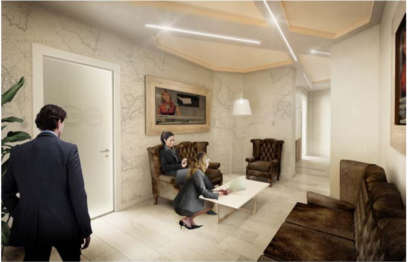
Rendering SALA ATTESA