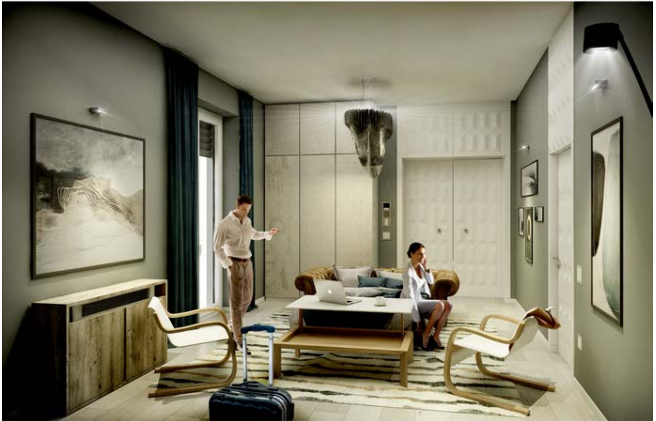
Rendering SALA RELAX