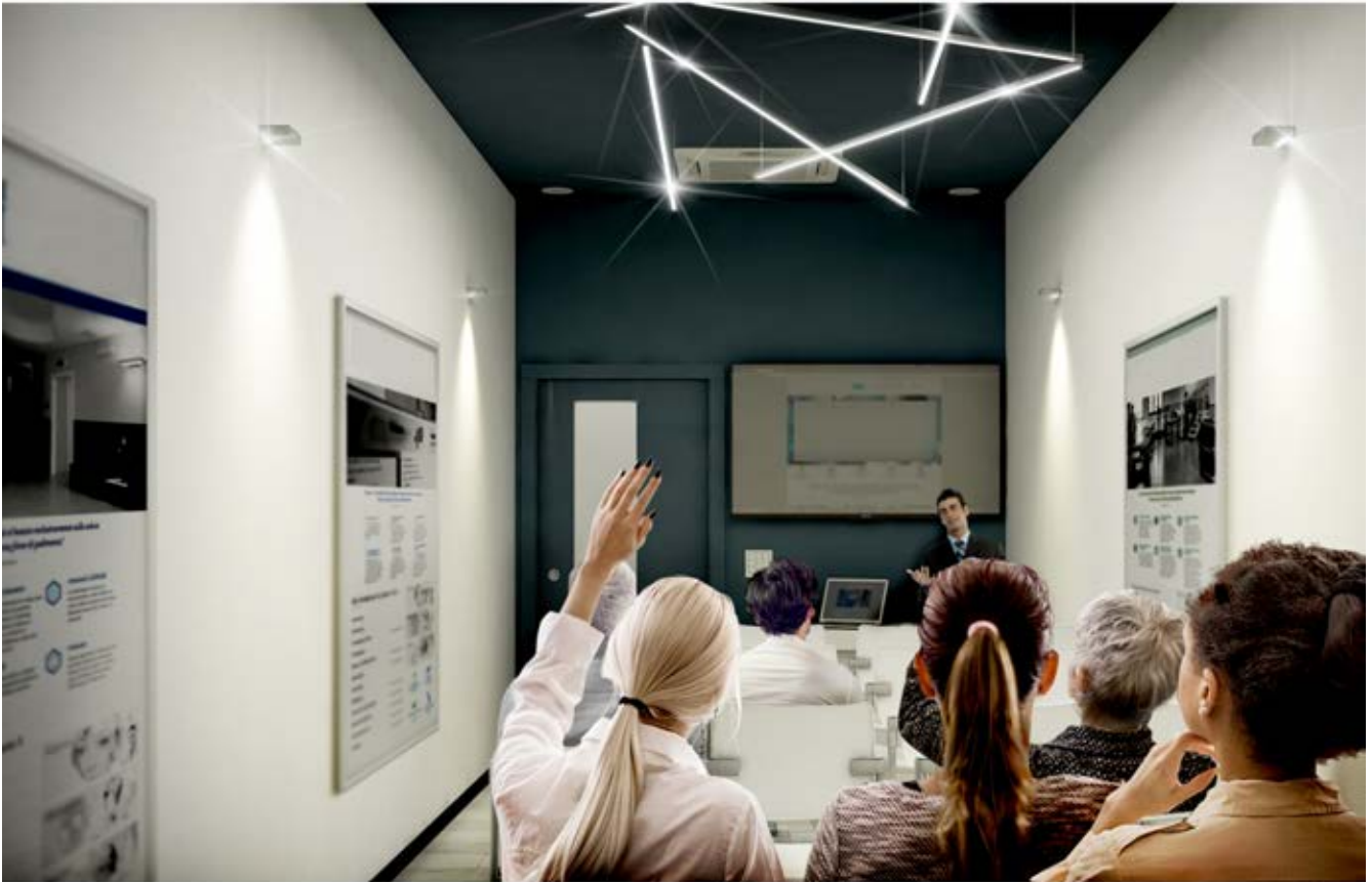
Rendering SALA RIUNIONI VICEPRESIDENZA