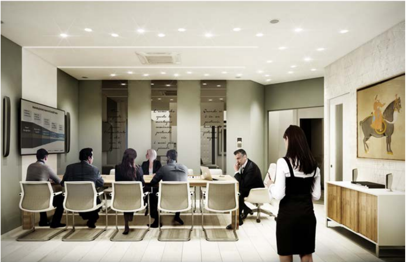
Rendering SALA RIUNIONI PRESIDENZA