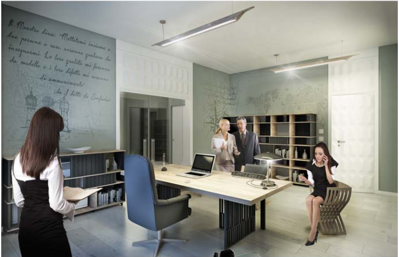
Rendering UFFICIO PRESIDENZA