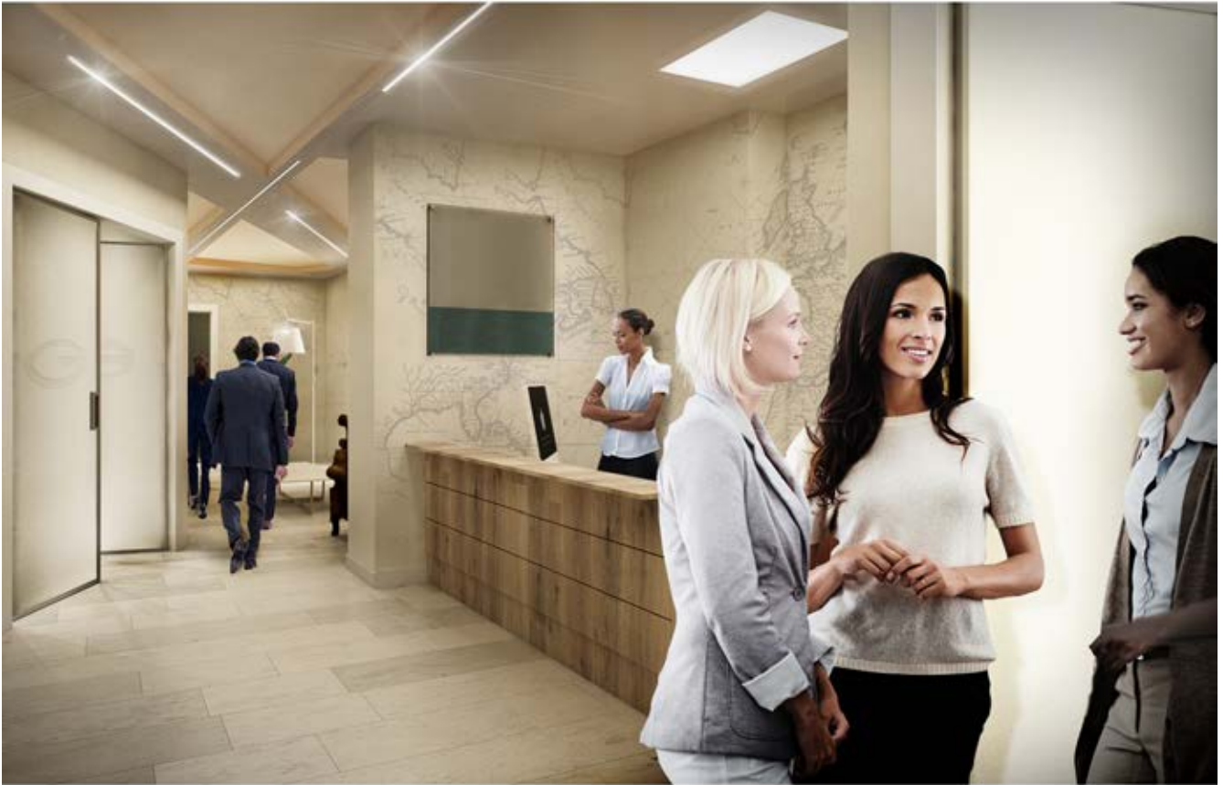
Rendering HALL INGRESSO