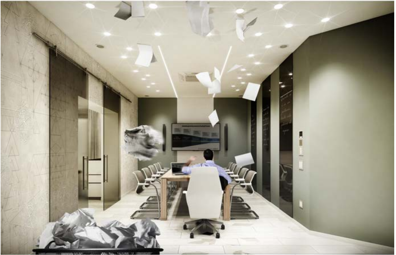
Rendering SALA RIUNIONI PRESIDENZA