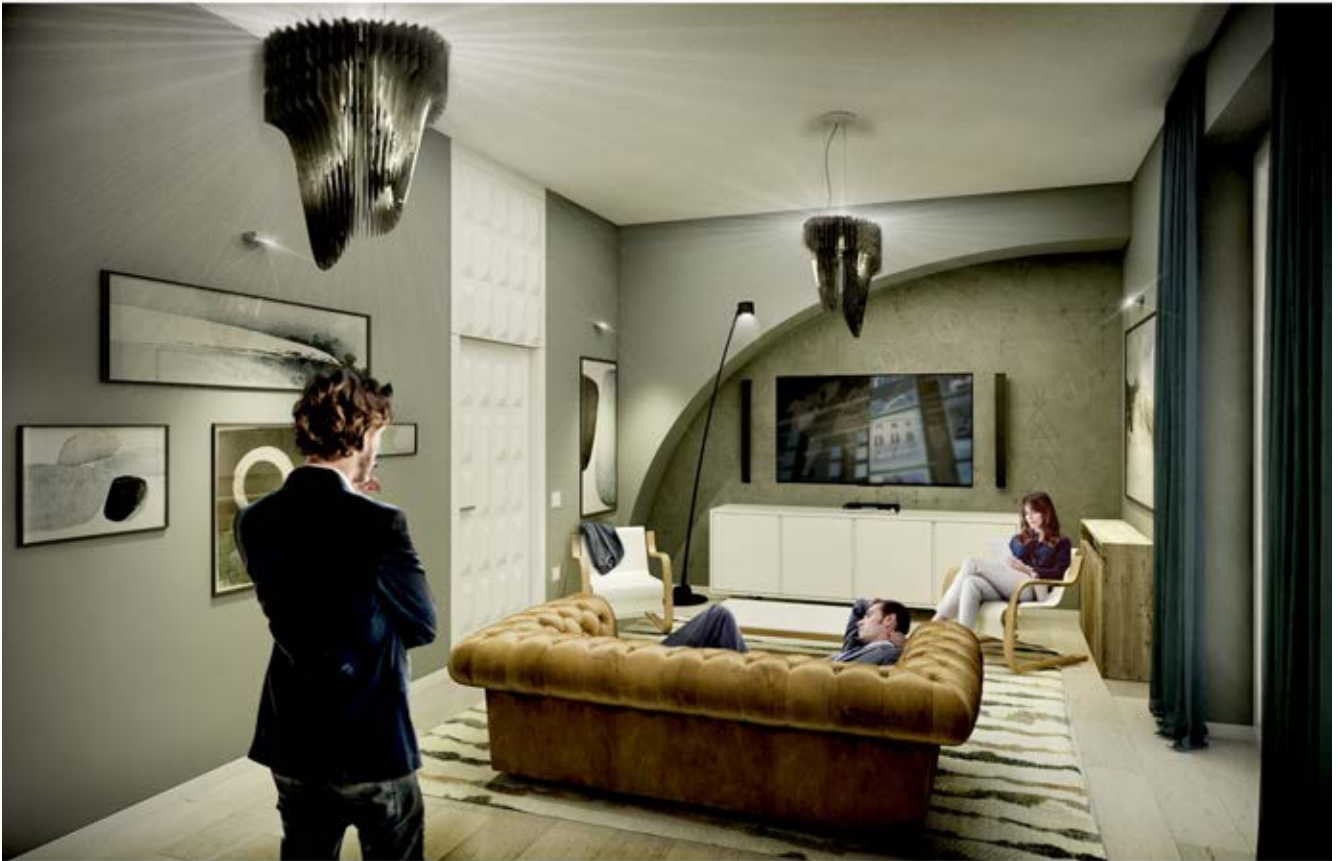
Rendering SALA RELAX