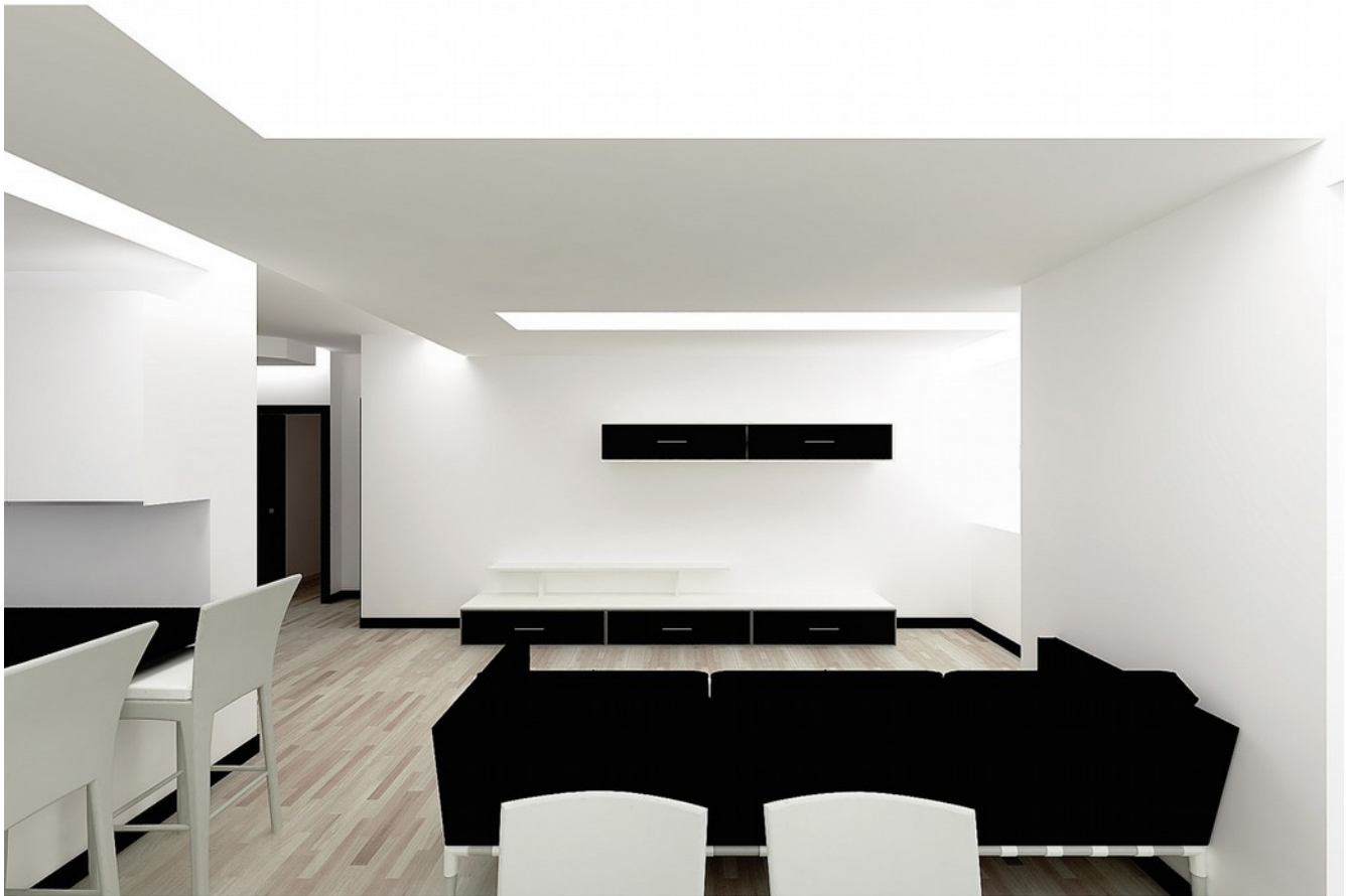
vista render soggiorno