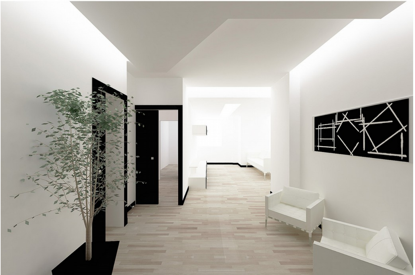
vista render ingresso