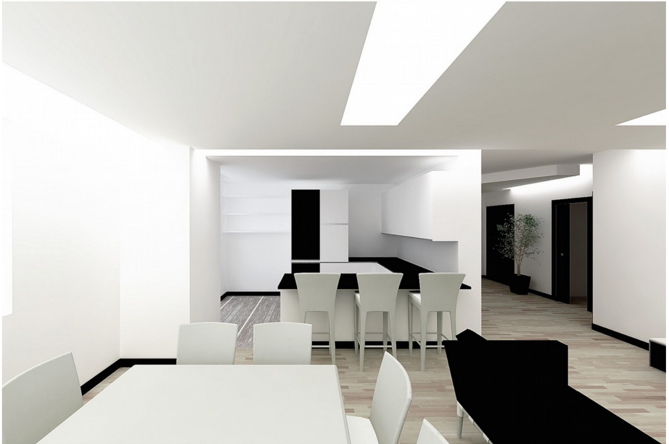
vista render soggiorno/cucina